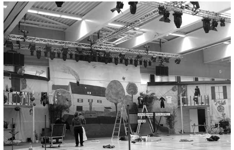
Die Sporthalle verwandelt sich in eine Show-Bühne.

Eine Lastwagen-Ladung voller Technikmaterial.