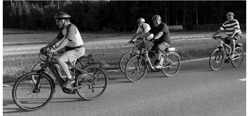
Mit dem Velo zügig unterwegs.